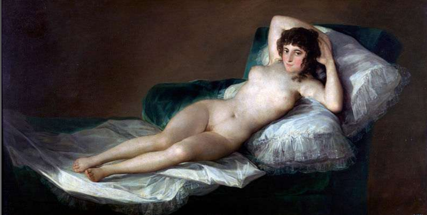
Obr. 5 Nahá Moja