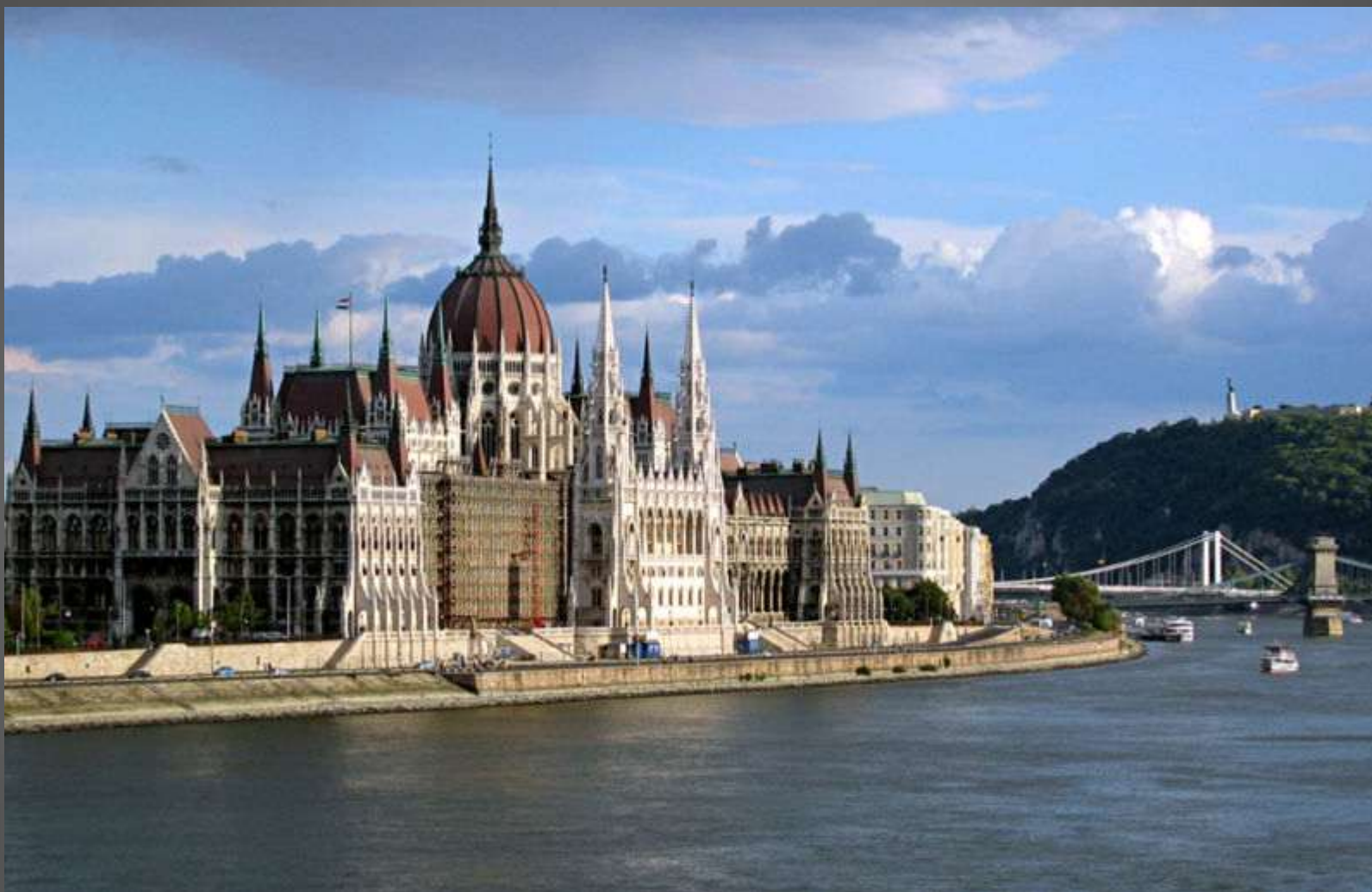
Obr. 2 Parlament v Budapešti