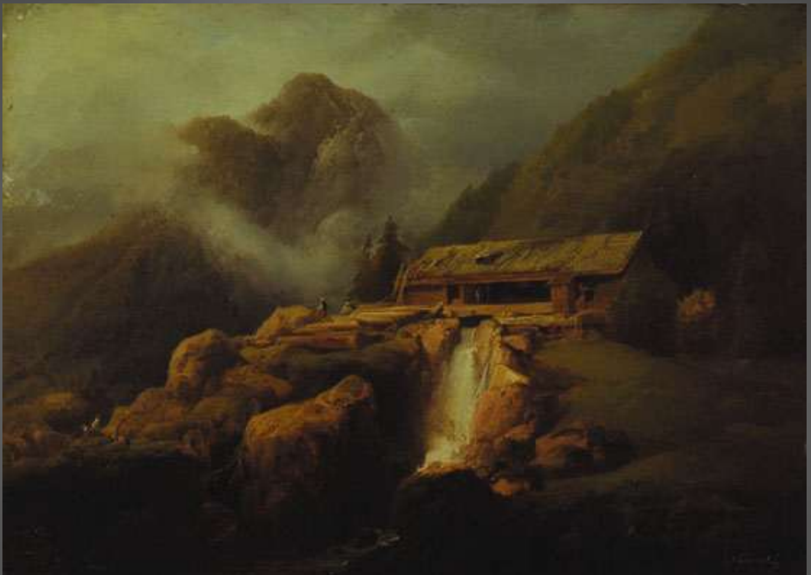
Obr. 10 Josef Navrátil Horská krajina u Vyššího Brodu