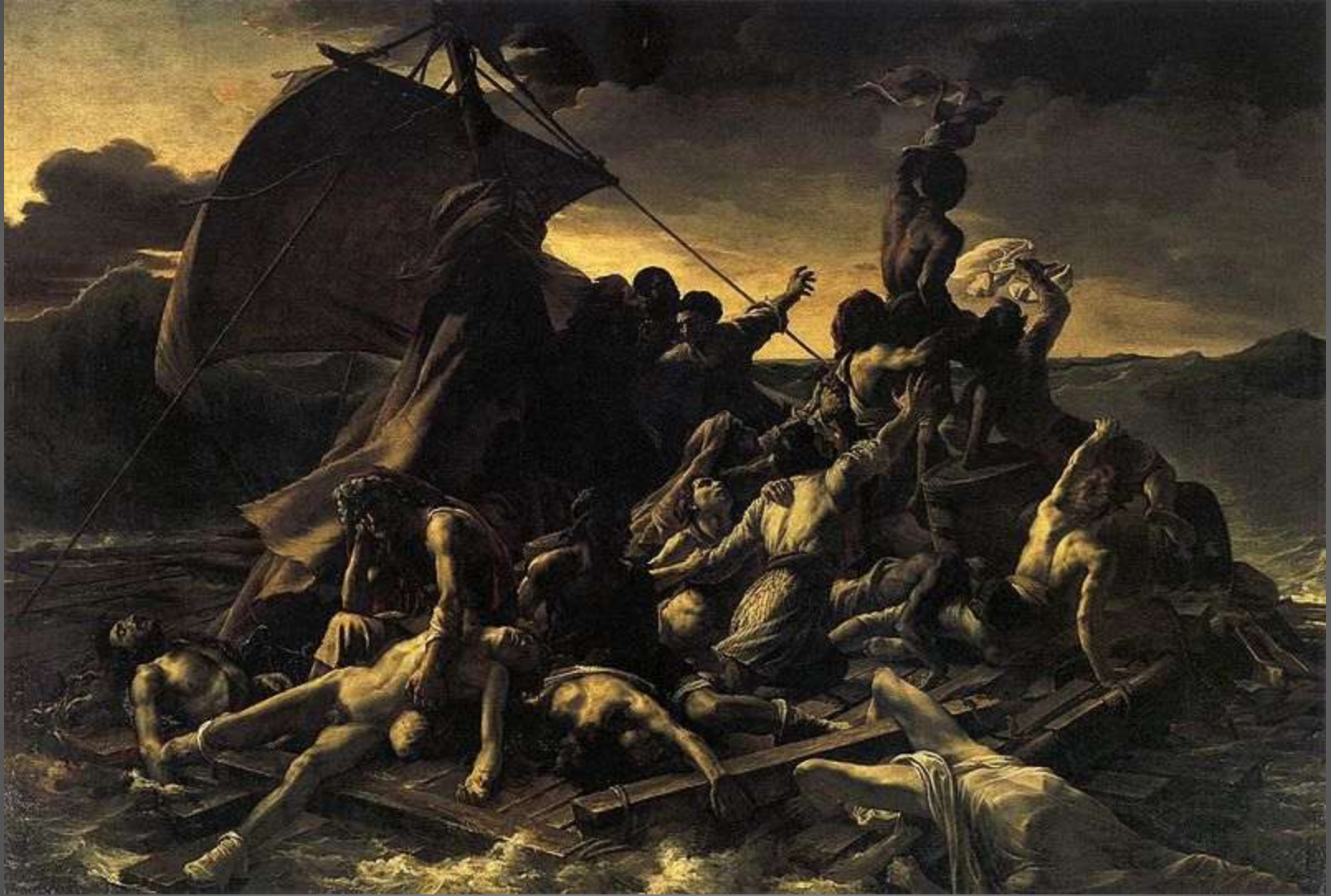
Obr. 4 Vor Medúzy