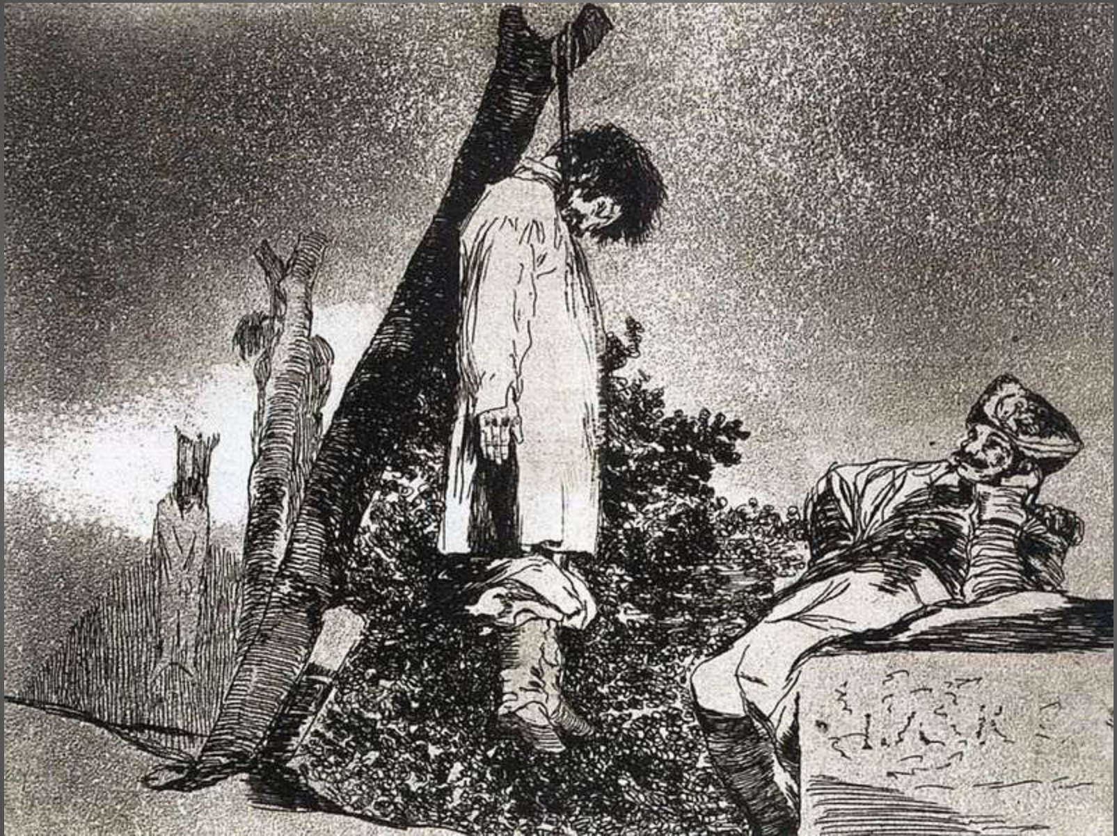
Obr. 7 Hruzy války