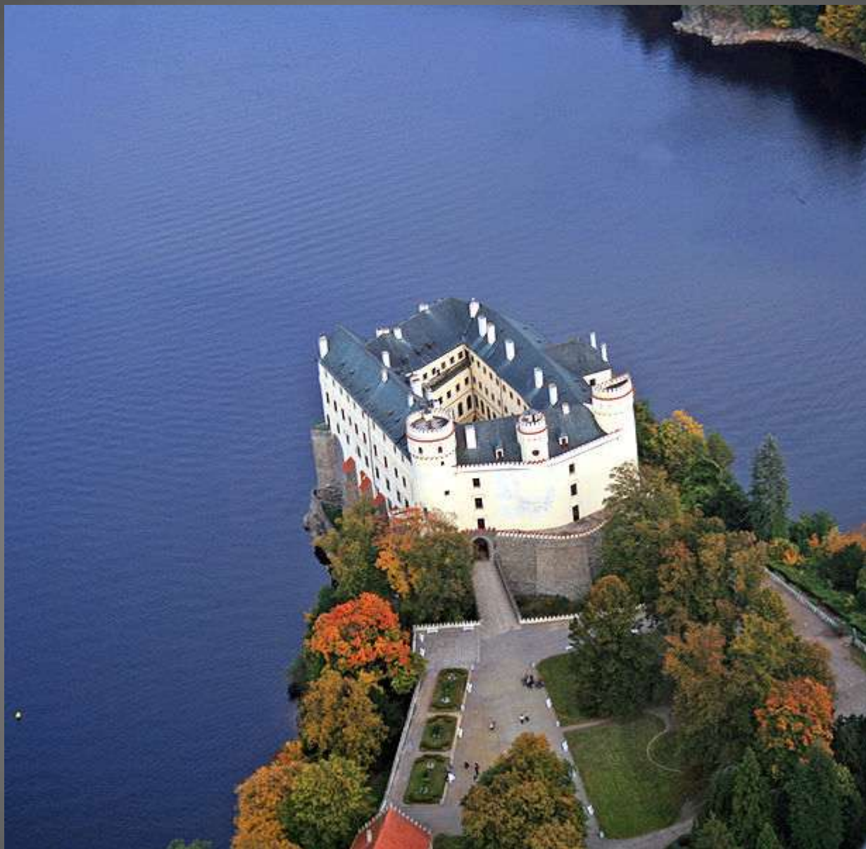
Obr. 9 Orlík