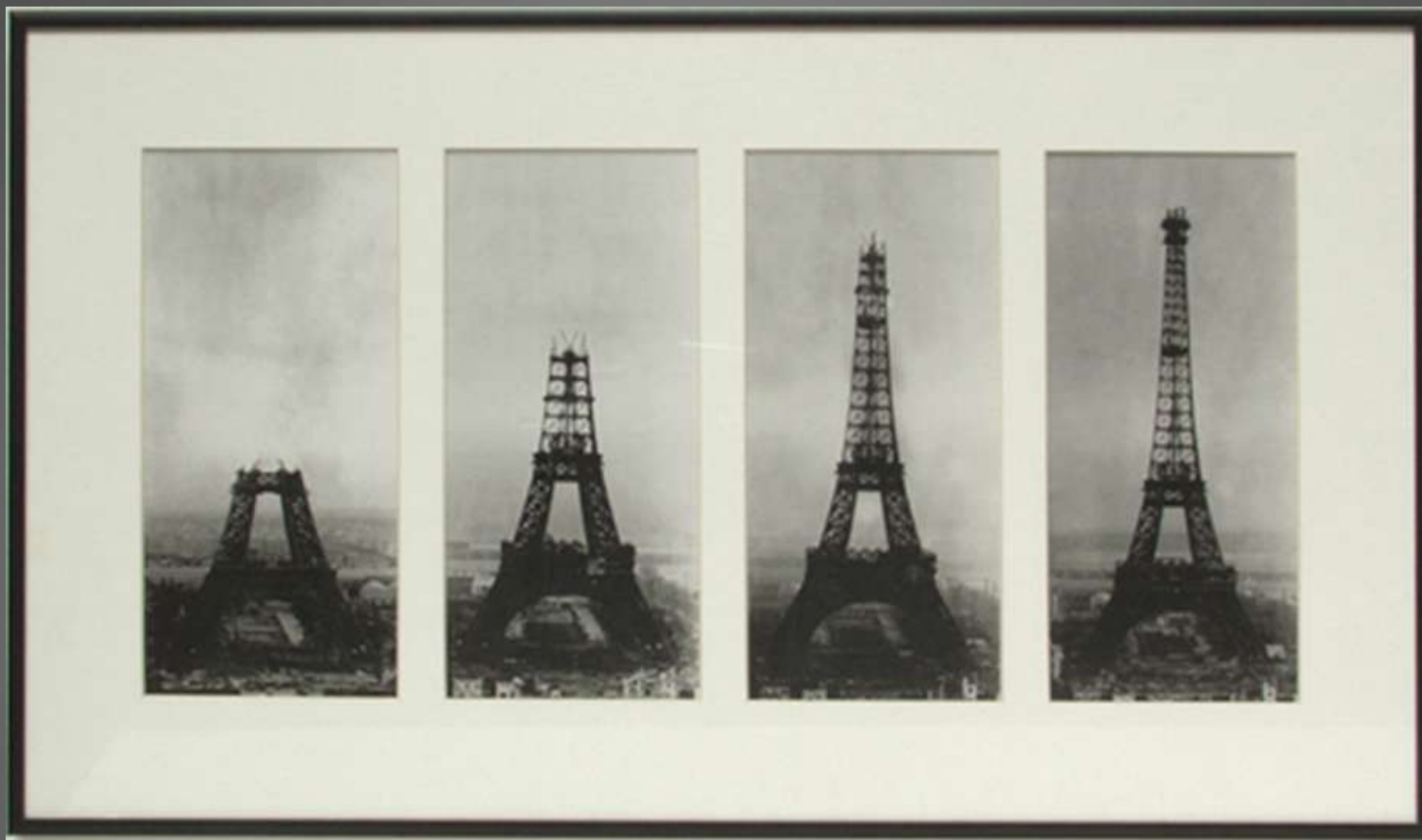
Obr. 8 Stavba Eiffelovy věže